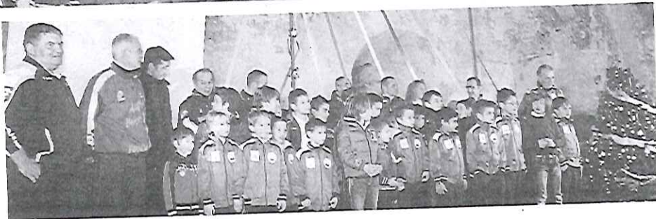
I 'pulcini' e i 'piccoli amici' sul palco nel corso della festa degli auguri

la Calcio Qualificata nel cremonese. Inoltre è salita sul palco la squadra femminile di volley che, dopo aver vinto il campionato l'anno scorso, oggi milita in seconda categoria.